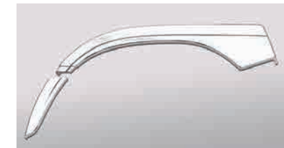
3124215 材質：樹脂 クロームメッキ 2分割 10穴車不可 交 LR