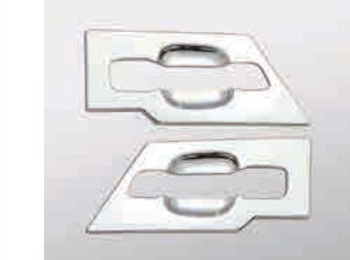
3125557 材質：樹脂 クロームメッキ か LR