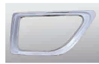
4979969620993 材質：樹脂 クロームメッキ CV-400 か 助