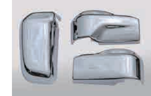
3093597 材質：樹脂 クロームメッキ か LR