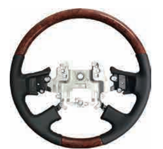
3250273 直径 450φ ウッド 交

交 交換 か かぶせ ス ステンレス 運 運転席 助 助手席 LR L/Rセット 上下 上下2段セット 車 年式・型式・車体番号が必要 表示価格は全て税抜価格です。別途、消費税が加算されます。