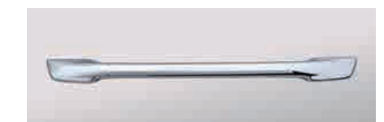
3120835 材質：樹脂 クロームメッキ か