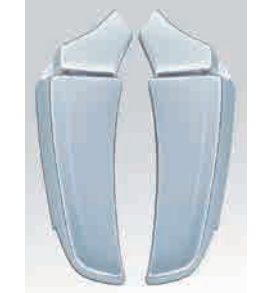
3120255 材質：樹脂 クロームメッキ 増t車不可 か LR