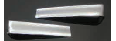
3124093 材質：樹脂 クロームメッキ ハーフタイプ か LR