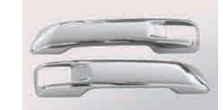
3125113 材質：樹脂 クロームメッキ か LR