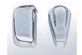
3093412 材質：樹脂 クロームメッキ か LR