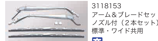
3118153 アーム&ブレードセット ノズル付 (2本セット) 標準・ワイド共用 交