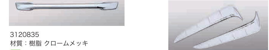
3128268 材質：樹脂 クロームメッキ か LR