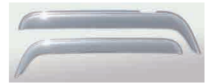
3124666 材質：樹脂 クロームメッキ か LR