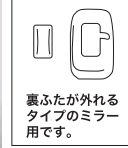
裏ふたが外れるタイプのミラー用です。