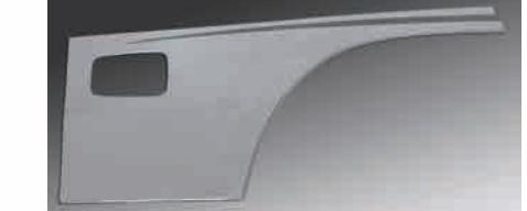
3124628 材質：樹脂 クロームメッキ ドアサイドランプの穴は土台のサイズです。 か LR