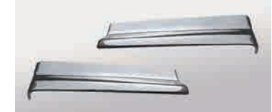
3124123 材質：樹脂 クロームメッキ か LR